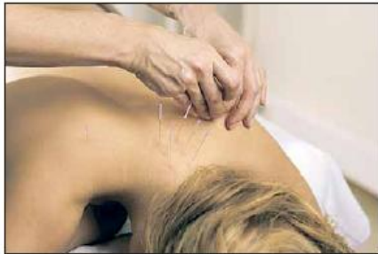
FAGLÆRT: Autorisasjon er viktig for å kvalitetssikre akupunkturfaget gjennom å stille krav til utdanning.

– Det er like viktig å stille kompetansekrav til de som behandler pasienter med nåler, som til dem som reparerer biler eller installerer toaletter. Stadig flere bruker akupunktur som en del av sitt behandlingstilbud, og da må de kunne vite